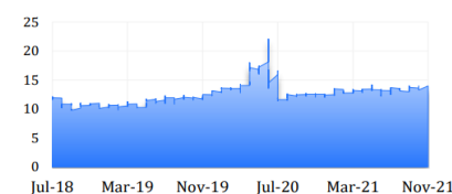
GIÁ NGŨ THẾ GIỚI (US CORN)